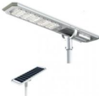
Przykładowy wygląd lampy solarnej