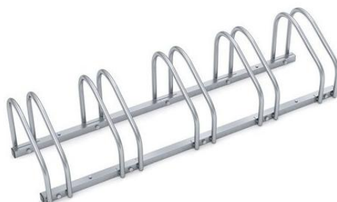
Przykładowy wygląd stojaka rowerowego

Stojak należy przytwierdzić w sposób stały do podłoża